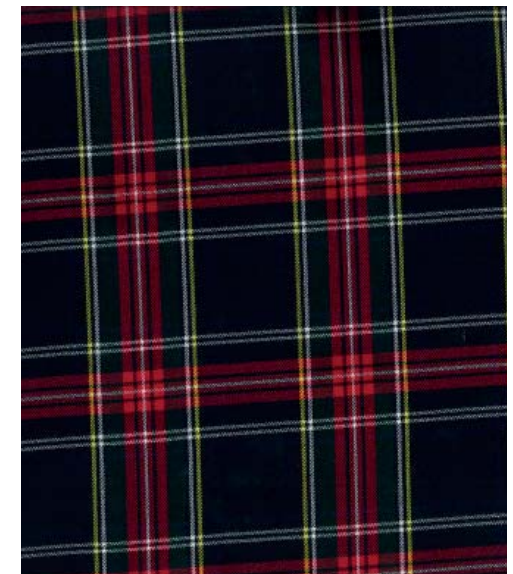
240 nero - riga rosa

MANIFATTURA FODERAMI CIMMINO srl NOLA (ITALY) tel. +39 0815108534 fax +39 0815109154 - www.cimmino.com scimmi@tin.it