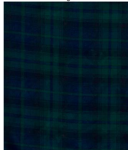
230 nero - verde